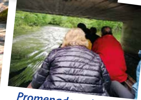
Promenade en bateau sur les canaux