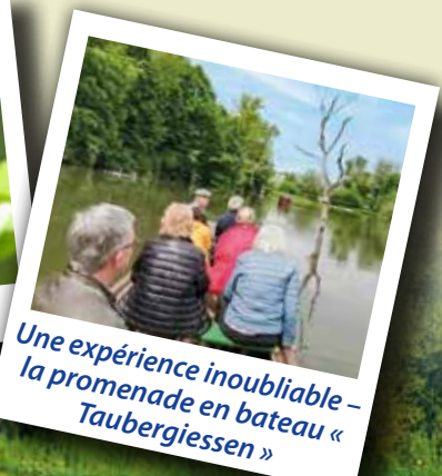
Une expérience inoubliable - la promenade en bateau « Taubergiessen »