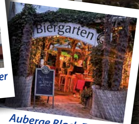
Auberge Black Forest