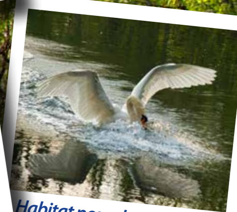
Habitat pour de nombreuses espèces animales