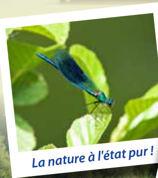
La nature à l'état pur !