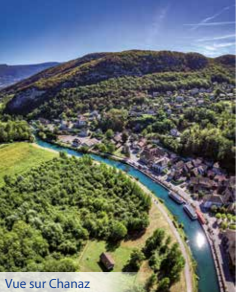
Vue sur Chanaz