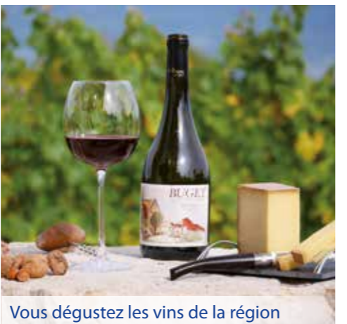
Vous dégustez les vins de la région