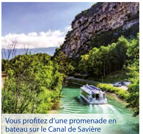
Vous profitez d'une promenade en bateau sur le Canal de Savière

2ème jour : Après un copieux petit-déjeuner, nous vous invitons à une conférence intéressante et passionnante sur le bien-être et la santé, suivie d'un déjeuner pour tous les participants. Avant de prendre le chemin du retour, un forgeron de cuivre vous fera découvrir son impressionnant artisanat . Cet artisanat ancestral est profondément enraciné dans le territoire savoyard depuis des siècles.