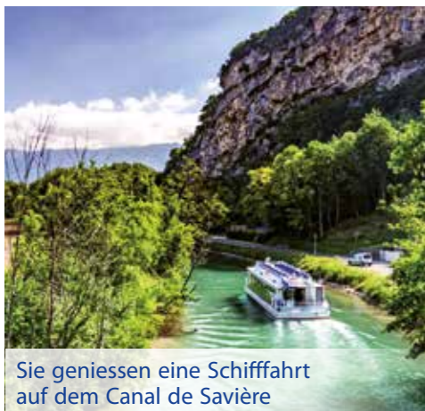
Sie geniessen eine Schiffahrt auf dem Canal de Savière

2. Tag: Nach dem reichhaltigen Frühstück laden wir Sie herzlich zu einem interessanten und spannenden Vortrag in Sachen Wellness und Gesundheit ein, mit anschliessendem Mittagessen für sämtliche Teilnehmer. Bevor wir die Heimreise antreten, wird Ihnen ein Kupferschmied seine beeindruckende Handwerkskunst näherbringen. Dieses uralte Handwerk ist mit der Gegend der Savoyen seit Jahrhunderten tief verwurzelt. Mit zahlreichen neuen Erlebnissen und Eindrücken kehren Sie in die Schweiz zurück.