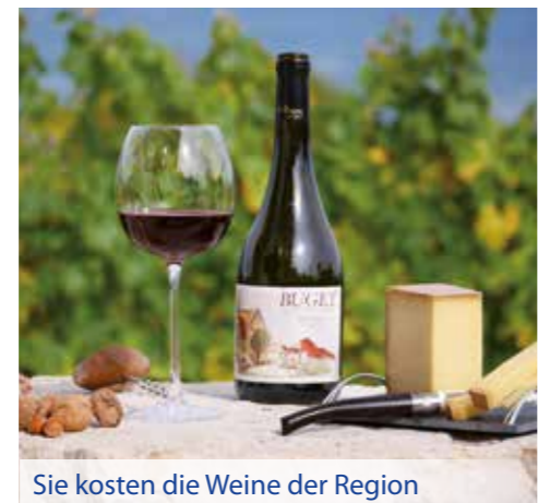
Sie kosten die Weine der Region