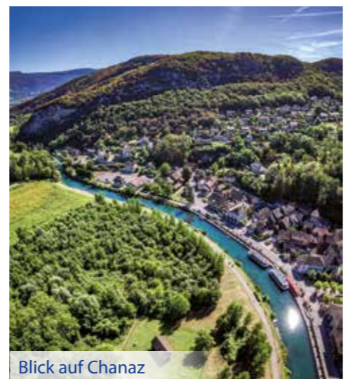
Blick auf Chanaz