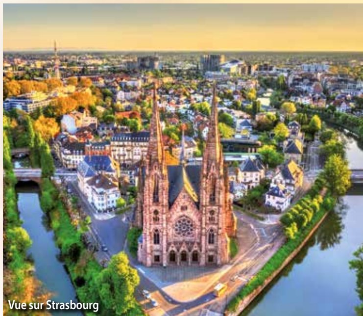
Vue sur Strasbourg

Voyage fluvial automnal sur le Rhin et la Moselle de Strasbourg à Coblence