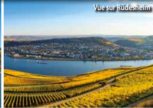
Vue sur Rudesheim