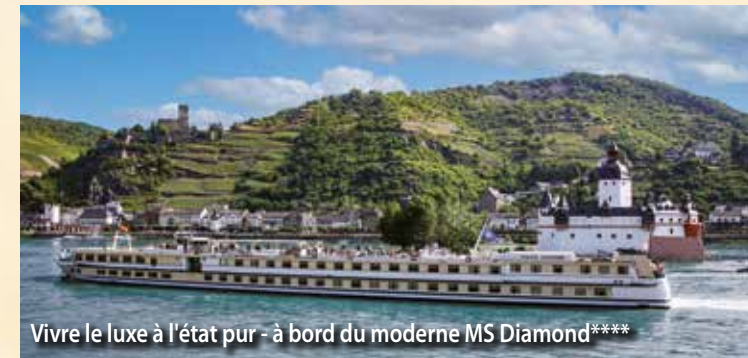
Vivre le luxe à l'état pur - à bord du moderne MS Diamond****

Le lieu d'embarquement le plus proche de chez vous communiqué début septembre.