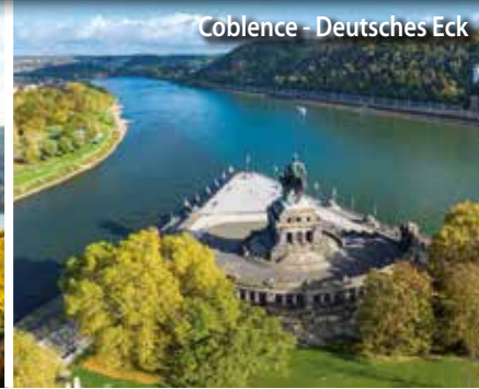
Coblence - Deutsches Eck