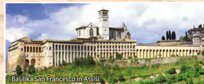
Basilika San Francesco in Assisi

Stärken Sie sich mit einem ausgiebigen Frühstück und geniessen Sie nochmals den Duft von Umbrien. Mit vielen tollen Eindrücken und Erinnerungen im Gepäck treten wir wieder die Heimreise an. Wir sind überzeugt, dass Sie viele schöne Erlebnisse und Geschichten Ihren Liebsten zu Hause erzählen können.