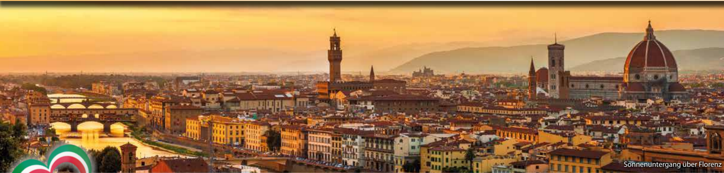
Sonnenuntergang über Florenz