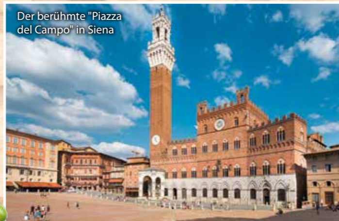
Der berühmte "Piazza del Campo" in Siena