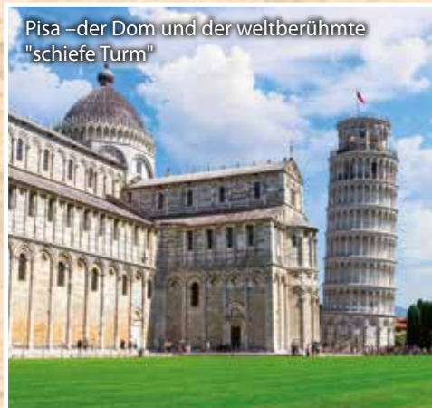
Pisa – der Dom und der weltberühmte "schiefe Turm"