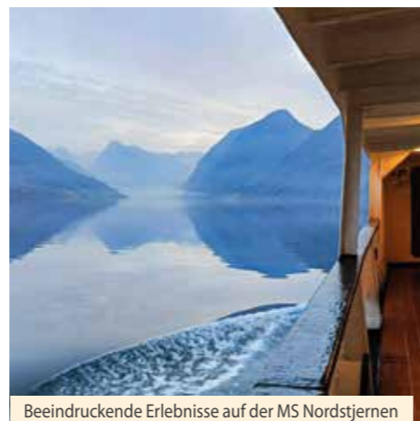
Beeindruckende Erlebnisse auf der MS Nordstjernen

Morgens erwartet uns eine Fahrt durch den pittoresken Saudafjord. Hinter jeder der zahlreichen Kurven eröffnet sich ein neuer Blick in die wundervolle Berglandschaft. Ein exklusives Erlebnis, denn die Nordstjernen ist das einzige international fahrende Passagierschiff, das diesen zauberhaften Fjord ansteuert. Sauda erreichen wir am späten Vormittag. Historisch ist das Städtchen geprägt von einer Schmelzhütte aus dem frühen 20. Jahrhundert, mit Wasserkraft betrieben und auch heute noch in Betrieb. Die werkseigene Arbeitersiedlung war vorbildlich angelegt und ist bis heute ein beliebtes Wohnquartier. Am Nachmittag verlässt die MS Nordstjernen Sauda zu einer landschaftlich reizvollen Fahrt in Richtung Süden.