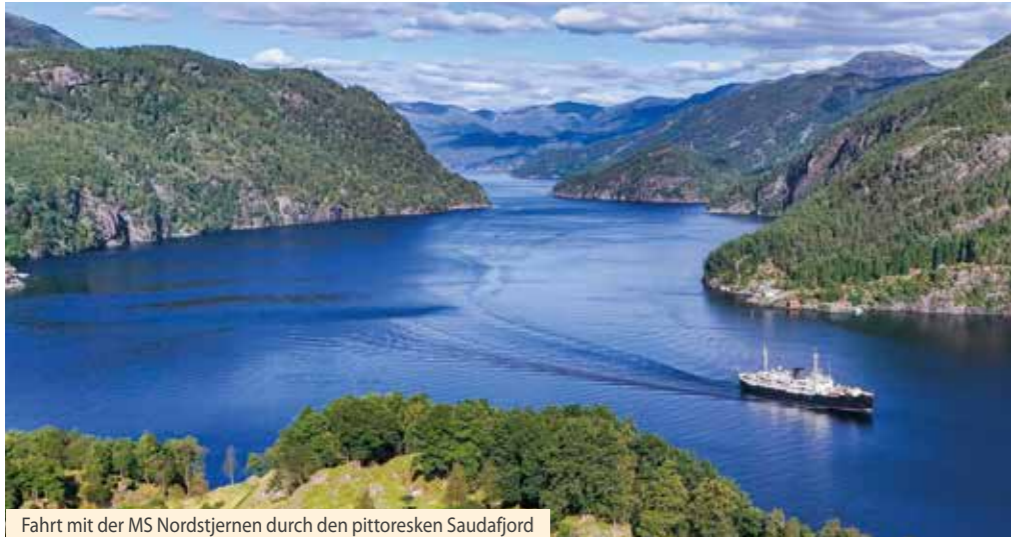
Fahrt mit der MS Nordstjernen durch den pittoresken Saudafjord

...zur Jubiläumssaison – 70 Jahre MS Nordstjernen