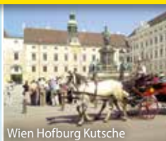
Wien Hofburg Kutsche