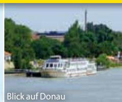
Blick auf Donau