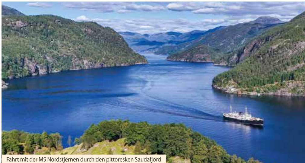
Fahrt mit der MS Nordstjernen durch den pittoresken Saudafjord

...zur Jubiläumssaison – 70 Jahre MS Nordstjernen