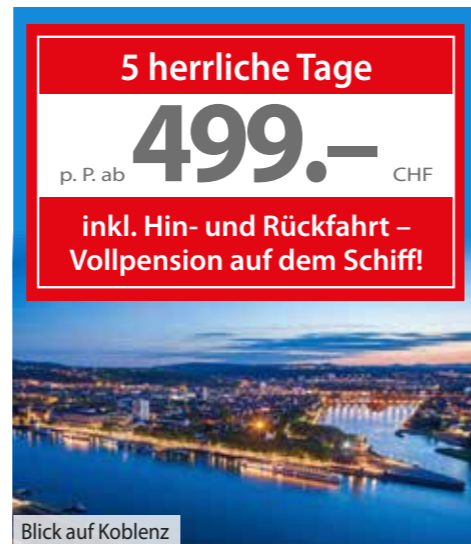
Blick auf Koblenz