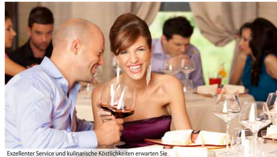
Exzellenter Service und kulinarische Köstlichkeiten erwarten Sie

inkl. Hin- und Rückfahrt – Vollpension auf dem Schiff!