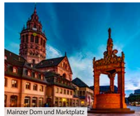
Mainzer Dom und Marktplatz

5. Tag - 22.12.2023: Mainz – Heimreise Nach dem Frühstück folgt die Ausschiffung und danach die Rückfahrt an Ihren Einstiegsort, welchen wir am frühen Nachmittag erreichen.