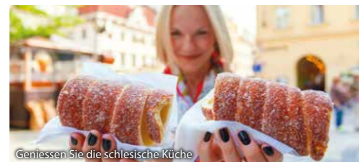
Geniessen Sie die schlesische Küche

Gut gestärkt vom Frühstück starten Sie heute zu einem Ausflug nach Breslau. Die Stadt liegt verteilt auf 12 Inseln an der Oder. Das Stadtbild ist geprägt von jeder Menge Kanälen und mehr als 100 verschiedenen Brücken.