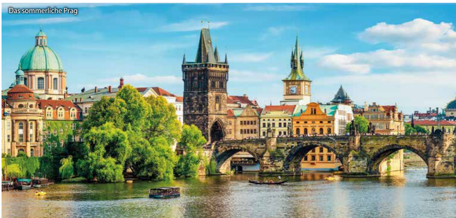
Das sommerliche Prag

BUDWEIS • KATTOWITZ • KRAKAU • BRESLAU • PRAG