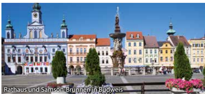
Rathaus und Samson-Brunnen in Budweis

Nach dem Frühstück machen wir erst einen Abstecher nach Budweis, wo Sie Zeit haben die Stadt auf eigene Faust zu erkunden. Die geschichtsträchtige Stadt an der Moldau und der Malsch ist den meisten wohl bekannt durch das berühmte Bier. Die pittoreske Stadt hat aber viel