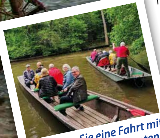
Genießen Sie eine Fahrt mit den traditionellen Booten

Bitte beachten Sie: Bei schlechter Witterung wird ein Alternativ-Programm angeboten.