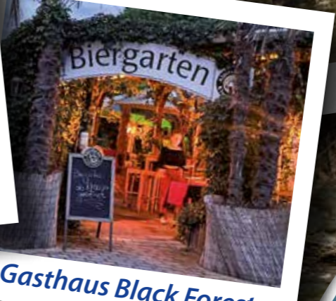
Gasthaus Black Forest