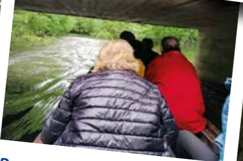
Bootsfahrt über die Kanäle