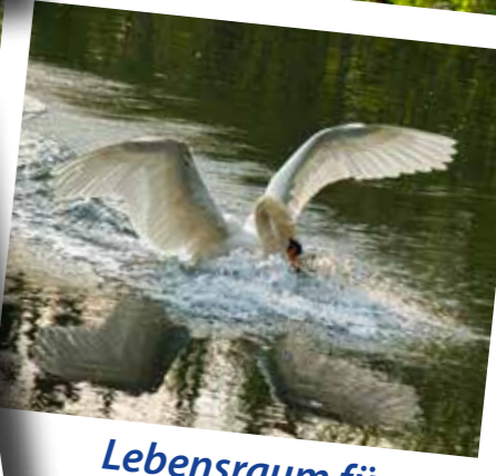
Lebensraum für zahlreiche Tierarten