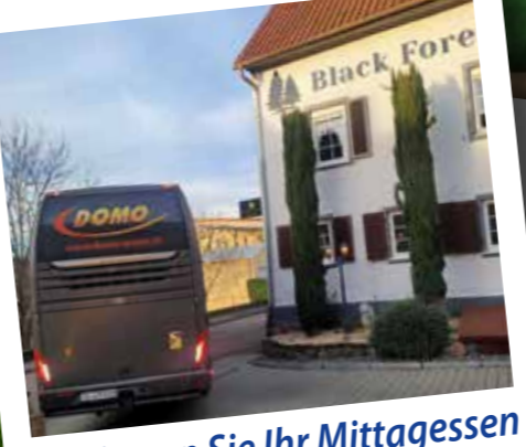
Genießen Sie Ihr Mittagessen im Gasthaus Black Forest