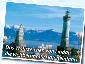
Das Wahrzeichen von Lindau, die weltberühmte Hafeneinfahrt

Wichtig! Bitte unbedingt ID oder Reisepass mitbringen!