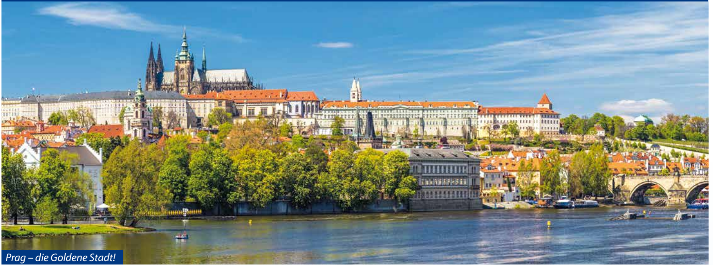
Prag – die Goldene Stadt!

Prag | Melnik | Litomerice | Sächsische Schweiz (Dresden) | Kralupy | Prag | auf der MS Florentina