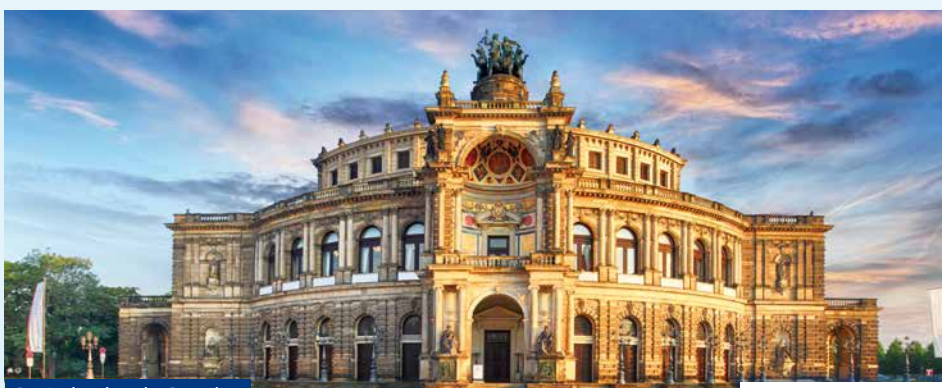
Beindruckend – Dresden