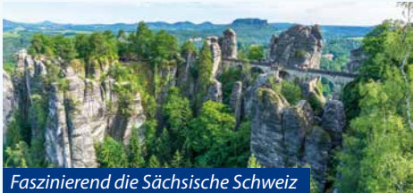
Faszinierend die Sächsische Schweiz

Nach dem Frühstück Ausschiffung und bequeme Busfahrt zurück zum Einsteigeort.