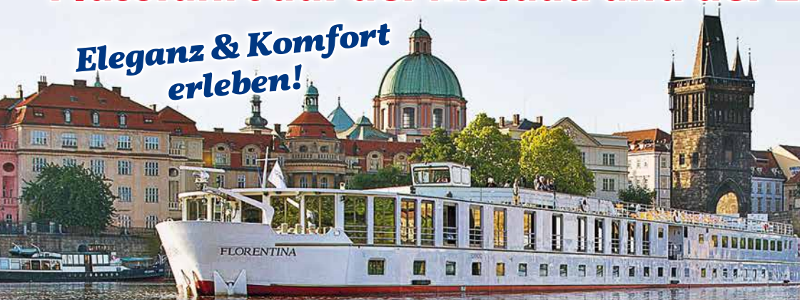
Die MS Florentina – Der Klassiker – Bei Schweizer Gästen extrem beliebt!

8 Tage statt 1390.- CHF ab 1190.- CHF Fahrt im Luxus-Reisebus und Vollpension auf dem Schiff!