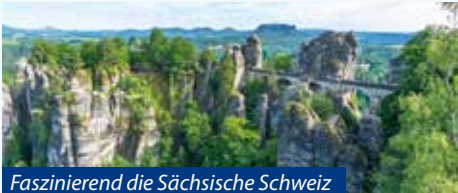
Faszinierend die Sächsische Schweiz

Nach dem Frühstück Ausschiffung und bequeme Busfahrt zurück zum Einsteigeort.