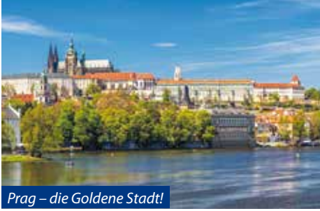
Prag – die Goldene Stadt!

tiver Ausflug nach Mlada Boleslav mit Besichtigung des Skoda-Werks mit Museum. Weiterfahrt nach Kralupy.