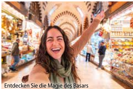
Entdecken Sie die Magie des Basars

Nach einem letzten gemeinsamen Frühstück heisst es Abschied nehmen von Istanbul – einer Stadt, die wie keine andere Orient und Okzident, Geschichte und Gegenwart auf unvergessliche Weise miteinander verbindet. Nach dem Transfer zum Flughafen treten Sie Ihren Rückflug in die Schweiz an – reich an wunderschönen Erinnerungen und voller Vorfreude auf die nächste DOMO-Reise!