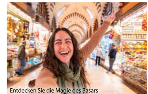
Entdecken Sie die Magie des Basars

Nach einem letzten gemeinsamen Frühstück heisst es Abschied nehmen von Istanbul – einer Stadt, die wie keine andere Orient und Okzident, Geschichte und Gegenwart auf unvergessliche Weise miteinander verbindet. Nach dem Transfer zum Flughafen Atatürk treten Sie Ihren Rückflug in die Schweiz an – reich an wunderschönen Erinnerungen und voller Vorfreude auf die nächste DOMO-Reise!