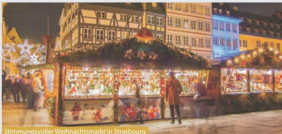
Stimmungsvoller Weihnachtsmarkt in Strasbourg