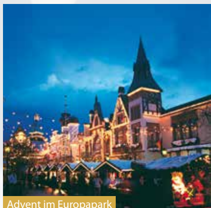
Advent im Europapark

Der Einsteigeort in Ihrer Nähe wird Ihnen ca. 10 Tage vor Abreise mitgeteilt.