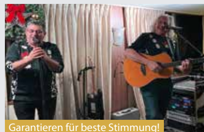
Garantieren für beste Stimmung!