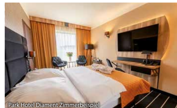
Park Hotel Diamant Zimmerbeispiel