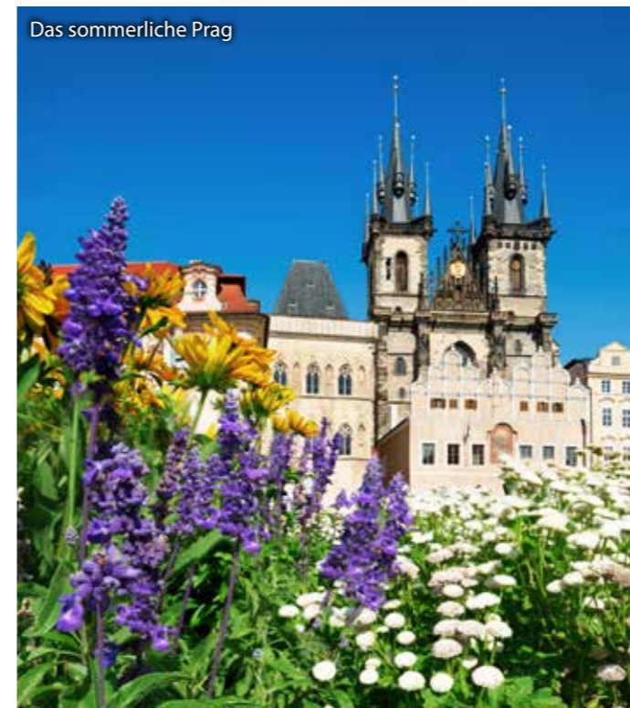
Das sommerliche Prag

BUDWEIS • KATTOWITZ • KRAKAU • BRESLAU • PRAG