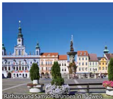
Rathaus und Samson-Brunnen in Budweis

Mit zahlreichen neuen Erlebnissen und Eindrücken kehren Sie am frühen Morgen in die Schweiz zurück.