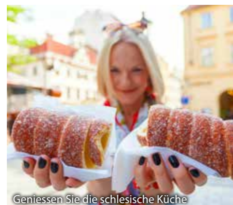
Geniessen Sie die schlesische Küche