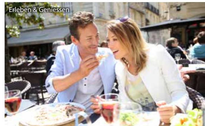
Erleben & Geniessen