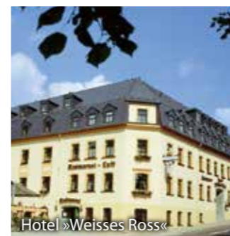
Hotel »Weisses Ross«

Nach dem Frühstück heisst es leider schon Abschied nehmen von Sachsen, mit zahlreichen neuen Erlebnissen und Eindrücken kehren Sie in die Schweiz zurück.