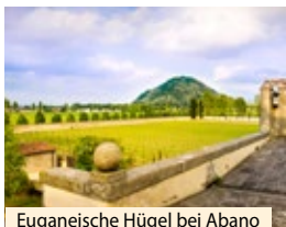
Euganeische Hügel bei Abano