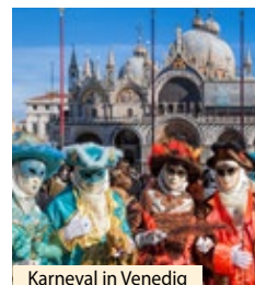
Karneval in Venedig

Rufen Sie gleich an! 044 828 60 40 oder per Email: info@domo-reisen.ch Begrenzte Platzzahl!