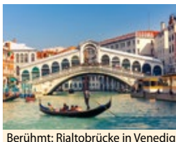
Berühmt: Rialto-Brücke in Venedig