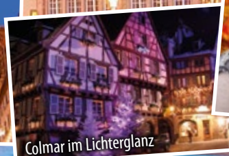
Colmar im Lichterglanz