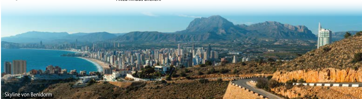
Skyline von Benidorm

Denia, der beliebte Ferienort am Mittelmeer, wird auch oft als das „Tor zur Costa Blanca“ bezeichnet. Das milde und gesunde Mittelmeerklima mit angenehmen 19 bis 20 Grad Celsius im Jahresdurchschnitt, sowie die fröhliche und aufgeschlossene Lebensart der Anwohner locken alljährlich zahlreiche Touristen in die Stadt.