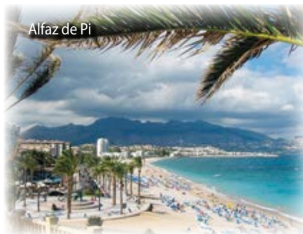
Alfaz de Pi

Benidorm's Hauptattraktion sind die beiden Strände „Playa de Levante“ und „Playa del Poniente“, feinsandig, tipptopp gepflegt und vor allem bestechend schön. Die schönsten Strände der spanischen Küste sind, wie jedes Jahr, ausgezeichnet mit der „Blauen Flagge“ für hervorragende Wasserqualität.